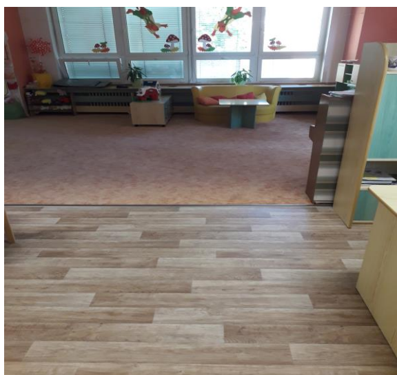
Ve 3, 5, 6, 7 a 8. třídě pokládka koberce a PVC