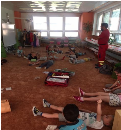
Polámal se mravenček