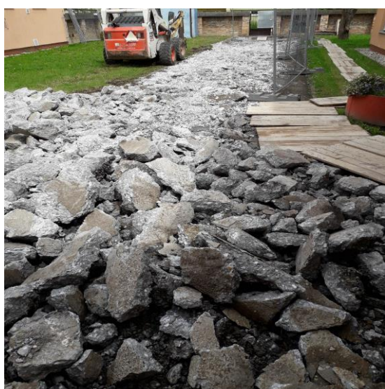
Realizace stavby – oprava chodníku