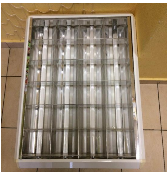
Výměna osvětlení MŠ Šrámkova