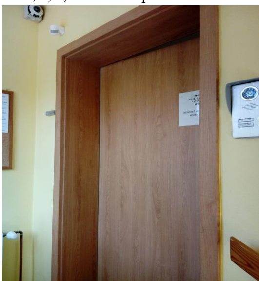
Dodávka a montáž dveří Sapeli