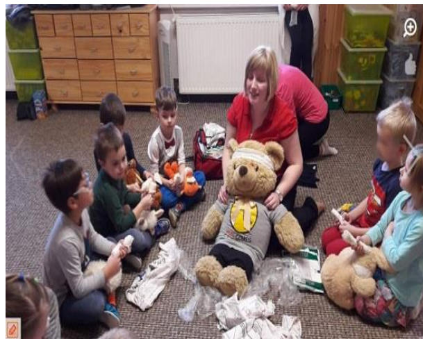
První pomoc s medvídkem Míšou

Naši školu navštívil dne 28. února 2019 instruktoři Českého červeného kříže Opava. S dětmi budou besedovat o zásadách poskytování první pomoci a ochraně zdraví. Děti si prohloubí znalosti o fungování lidského těla, vyzkouší si prakticky nácvik poskytnutí první pomoci, dozví se jak používat důležitá telefonní čísla integrovaného záchranného systému a pomoci her a soutěží své znalosti ověří. Na tento den si děti přinesou svého oblíbeného plyšového medvídka, zvířátko nebo panenku.