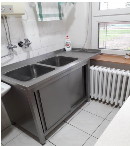
Nerez stůl se 2 dřezy – kuchyň 5. a 6. třída