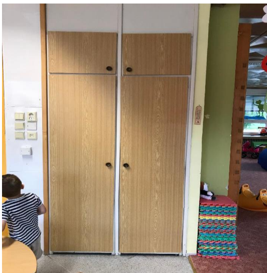
Oprava a montáž 5 ks vestavěných skříní