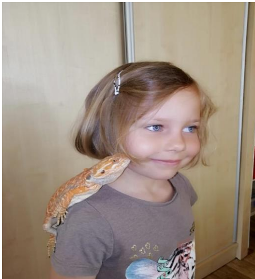
My se zvířat nebojíme