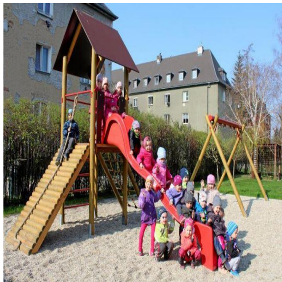
Oprava a dodání zahradních prvků