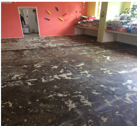
Pokládka koberců a PVC