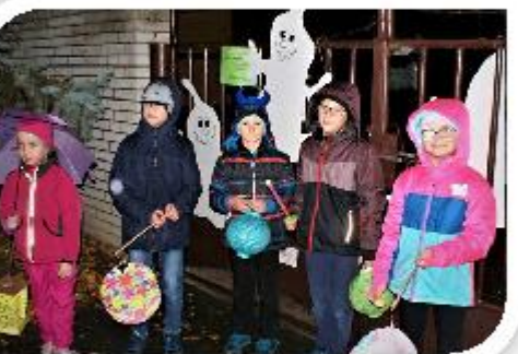
Se světýlky za strašidly