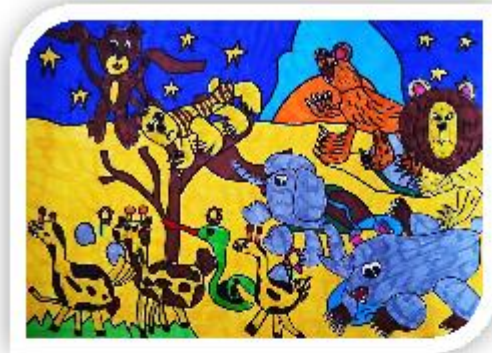
MMO „Park Joy Adamsonové - park, kde to žije!“