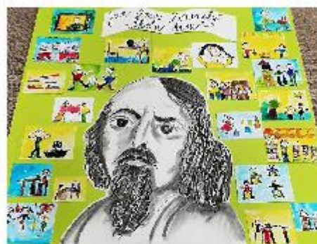
Jan Ámos Komenský – Škola hrou