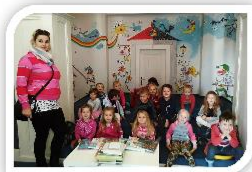
Knihovna P. Bezručů Opava