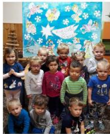
MSŠZe a VOŠ Opava – „Vánoční přání“