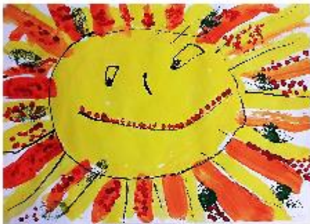
DDM Ostrava – „Barevný podzim“