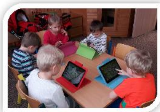
Šablony II. - výuka ICT