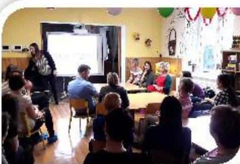
Beseda o školní zralosti dítěte