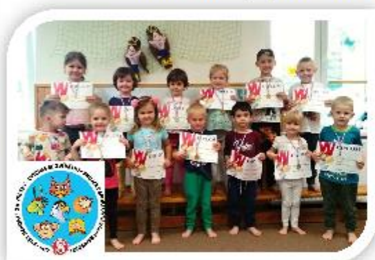
Cvičení se zvířátky - Česká obec sokolská