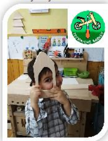
Technické školky - polytechnika