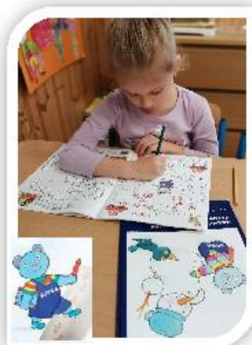
Medvídek Nivea - podpora školní zralosti