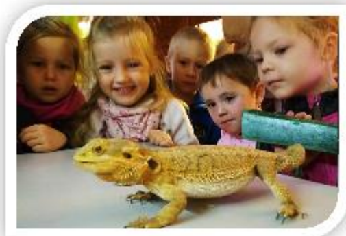
SVČ Opava - Minizoo