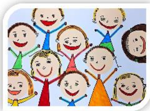
Školka plní děti