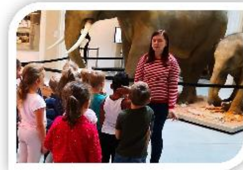
Slezské zemské muzeum