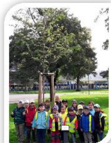
Den stromů- Náš strom svobody