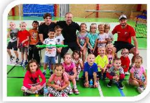
Sportování s SFC Opava