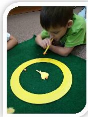
Skupinová logopedická prevence