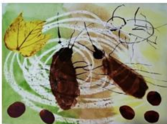
1. Barevný podzim 1. místo – Odeta Pernicová