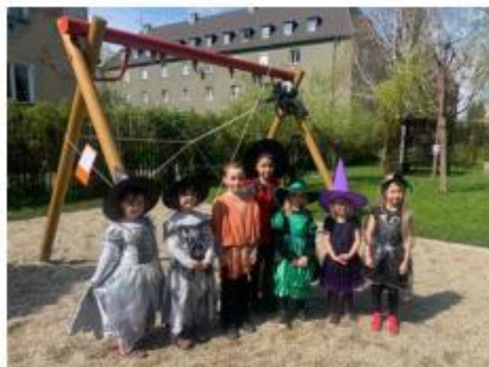
4. Pálení čarodějnic