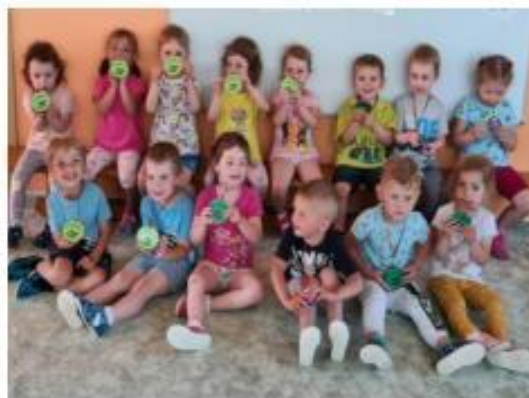
42. Hledání ztraceného pokladu