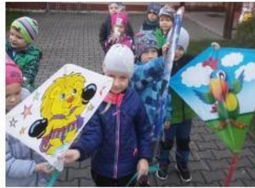
7. Pouštíme draky