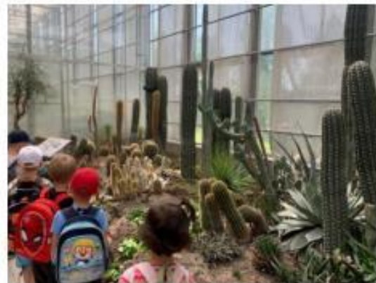
10. Arboretum Nový Dvůr - výlet