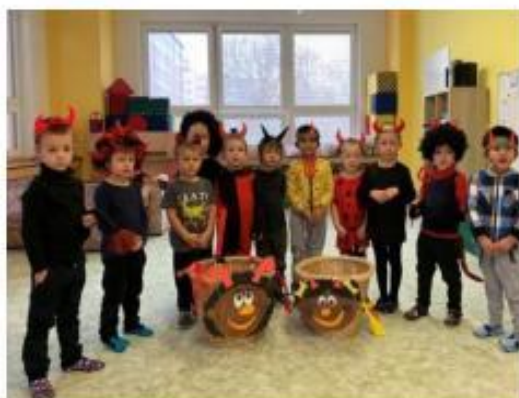
18. Čertovský den