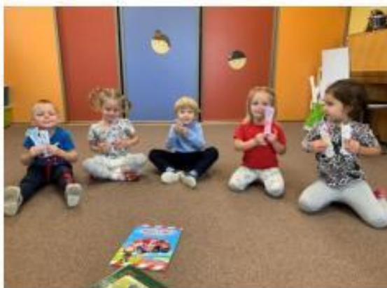
1. Celé Česko čte dětem