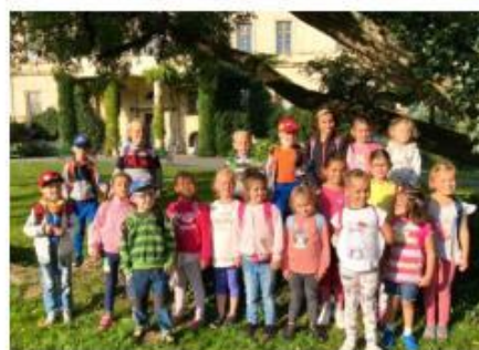
3. Výlet na zámek Raduň