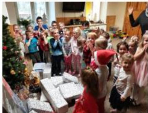
4. Vánoční den