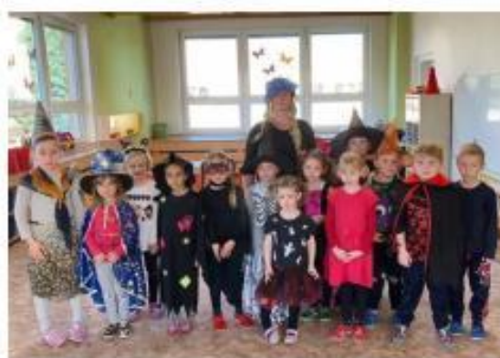
29. Slet čarodějnic