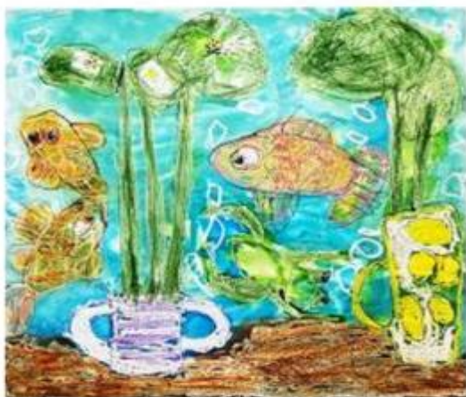
5. Děti malují na konto Bariéry – téma Voda