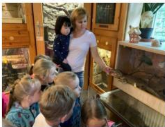
39. SVČ - Návštěva minizoo