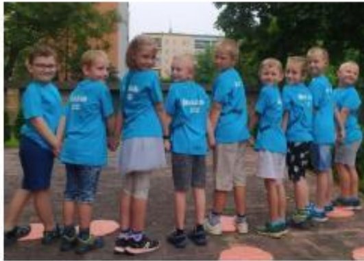
44. Loučení s předškoláky (2. třída)