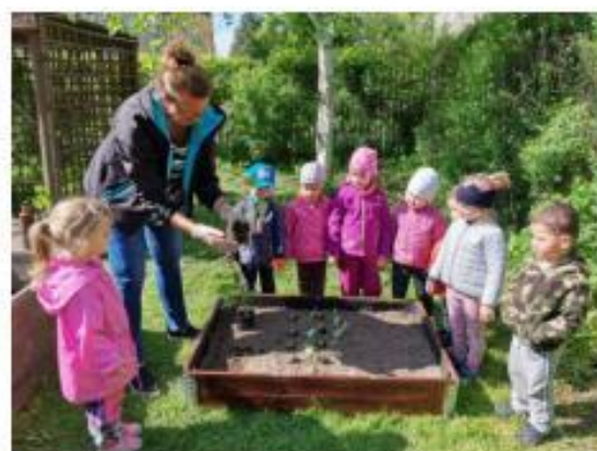
4. Měsíc školních zahrad