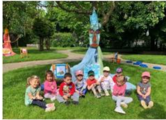
7. Den dětí – Putování čtyřmi královstvími