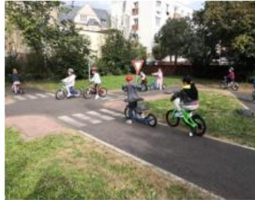
5. Dopravní hřiště