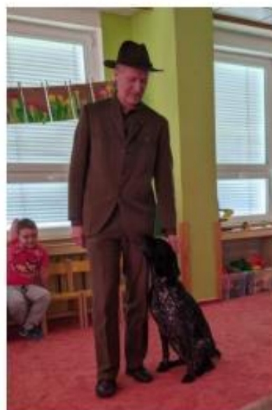
43. Beseda s myslivcem