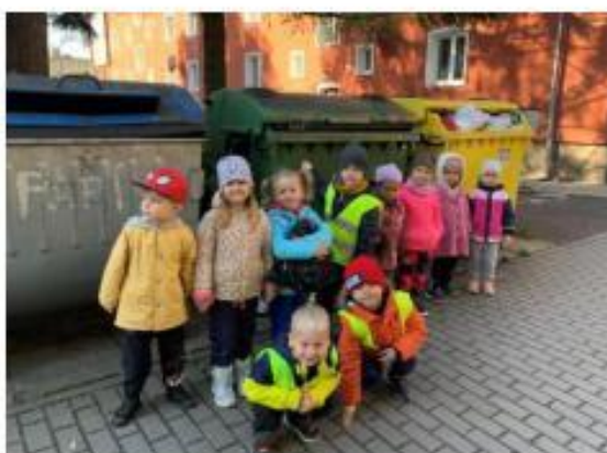
3. 72. hodin – Posbíráme, uklidíme...