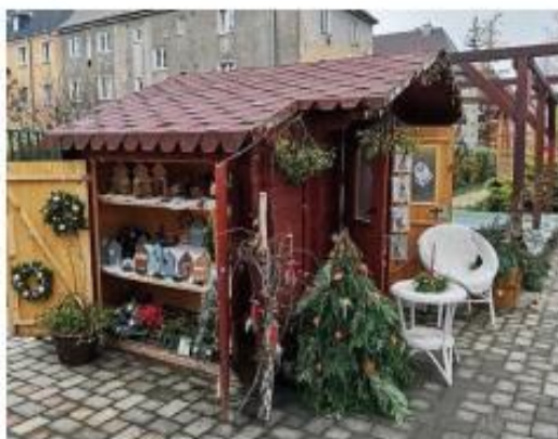
5. Vánoční jarmark