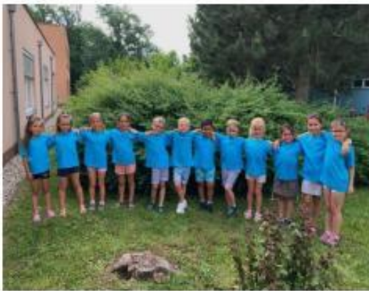
44. Loučení s předškoláky (8. třída)