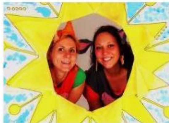
9. Divadélko Ententýky