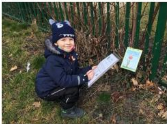
9. Rozkvetlý jarní plot *