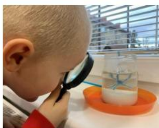
4. Eskymáci, kamarádi z Grónska