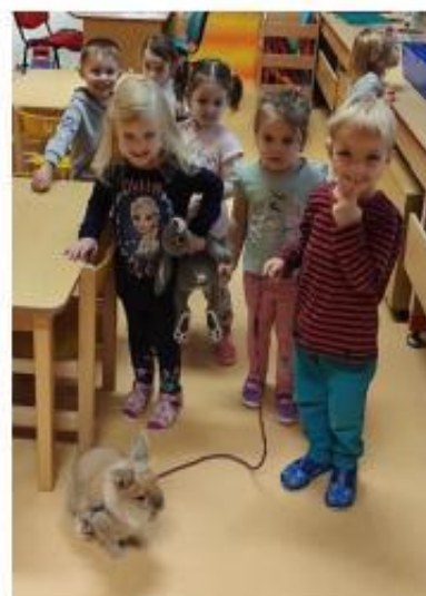
10. Den s králíčkem