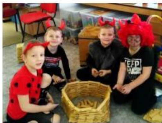
17. Čertovský den s Luciferem