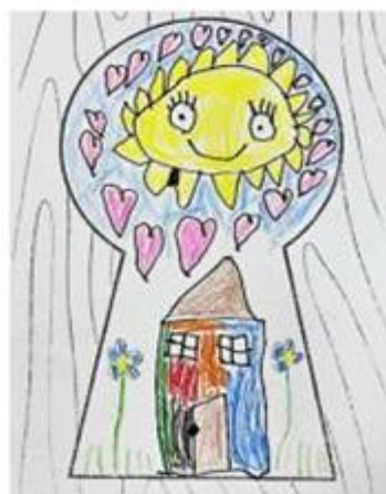
6. Klíčová dírka