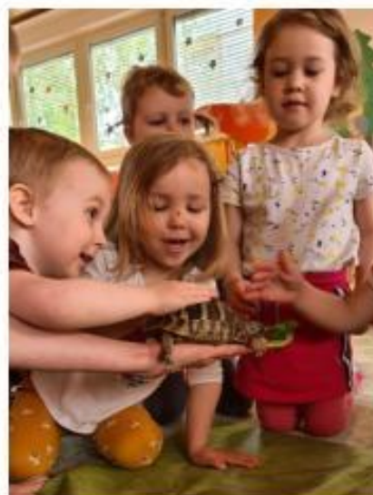
32. SVČ – Minizoo