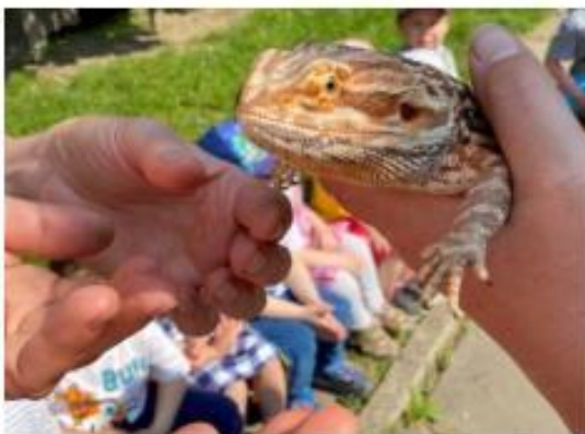
8. Edukační program – Ještěrky a ještěři