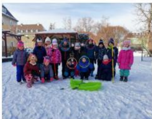
3. Zimní olympijské hry