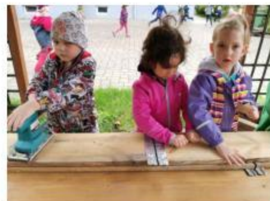
7. Polytechnická školka