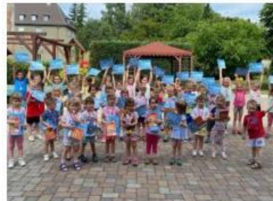
11. Letní olympiáda – ukončení projektu „Svět nekončí za vrátky, cvičíme se zvířátky“