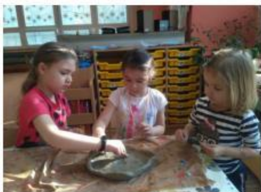
28. Včelí svět