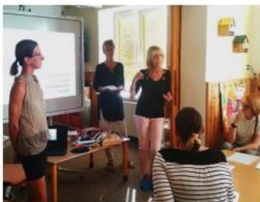
2. Třídní schůzka s rodiči