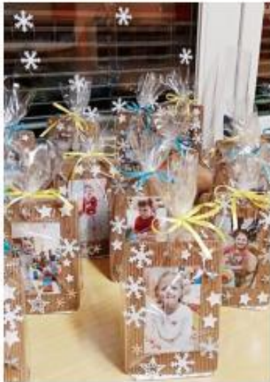
21. Vánoční posezení