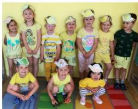
41. Den žlutých dinosaurů