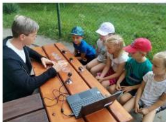
2. Žáci učí děti – Svět pod mikroskopem