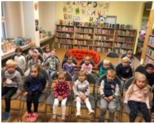
4. Návštěva knihovny