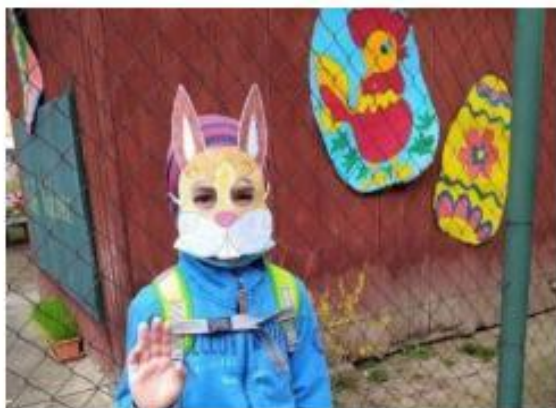
11. Zajíčková výzva *

* spolupráce s rodiči v době distančního vzdělávání (plnění výzev)