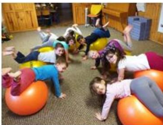
Cvičení s gymballony