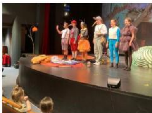
37. Loutkové divadlo Ostrava