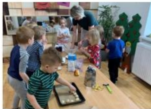
6. Skutečně zdravá školka