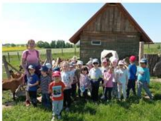
35. Kozí farma