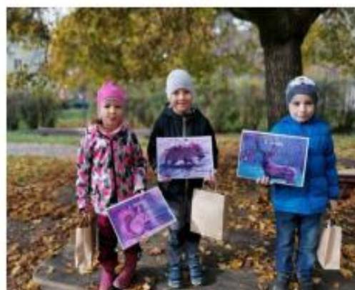
4. Sběr kaštanů a žaludů - ocenění