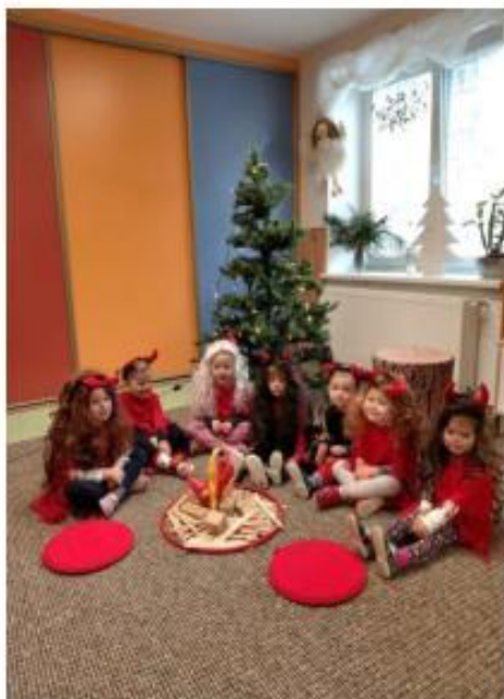
2. Čertovský den