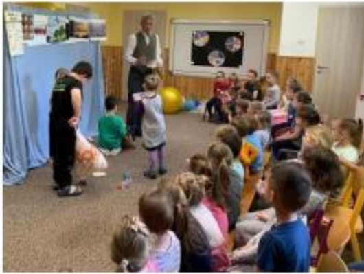
6. Ekologický slabikář – divadelní představení