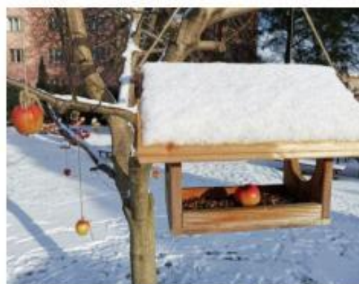
2. Ptáci nás potřebují