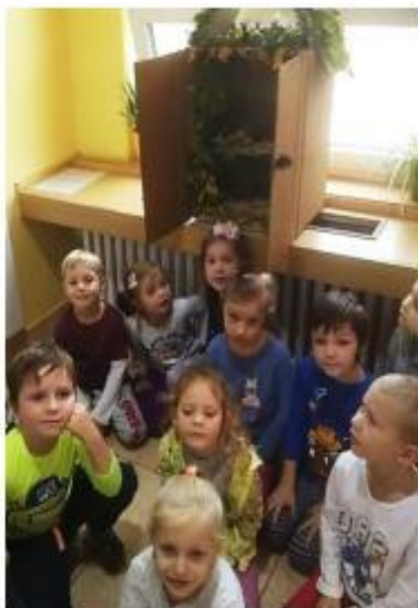
14. Uspávání broučků