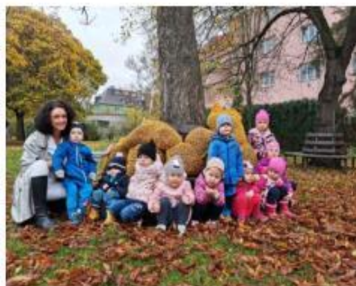
2. Setkání s panem myslivcem