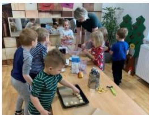
1. Vánoční pečení