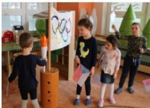
27. Zimní olympiáda