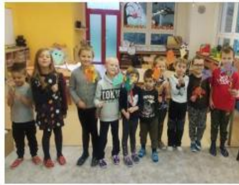
11. Hrátky s dračky