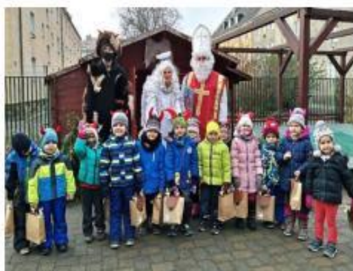
3. Mikulášská nadílka