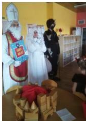
19. Mikulášská nadílka