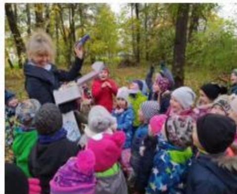
13. Cesta za pokladem