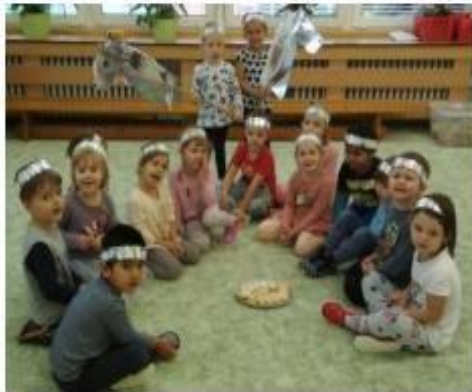
12. Svatý Martin...