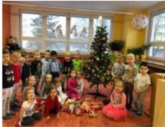
22. Vánoční den