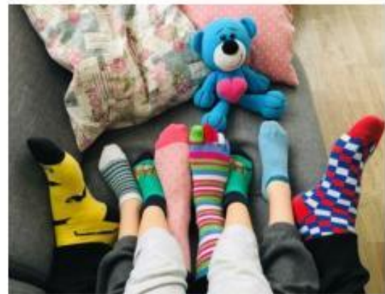
10. Na každou nožku jinou ponožku *