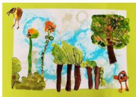
2. Vzduch pro život... Život na Zemi