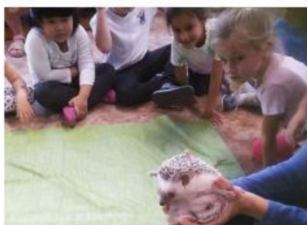
2. SVČ – Zvířátka kolem nás