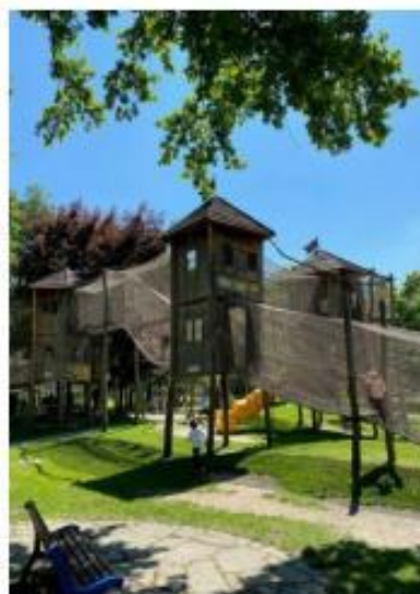
36. Mauglího stezka