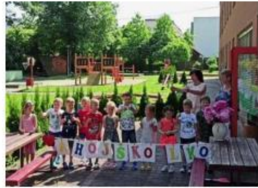
44. Loučení s předškoláky (7. třída)