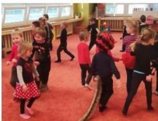
16. Hrátky s čertíky