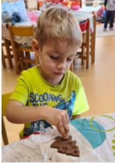
20. Vánoční tvoření