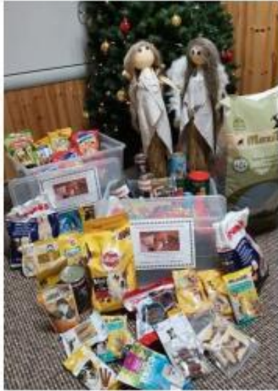
6. Sbíрка pro pejsky