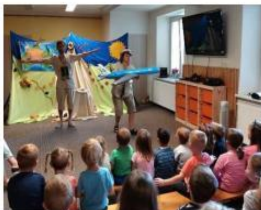
1. Divadlo Letadlo