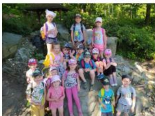
40. ZOO O strava