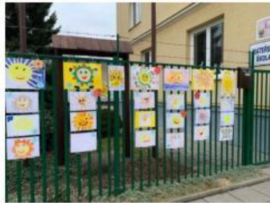
8. 0 nejzářivější sluníčko *